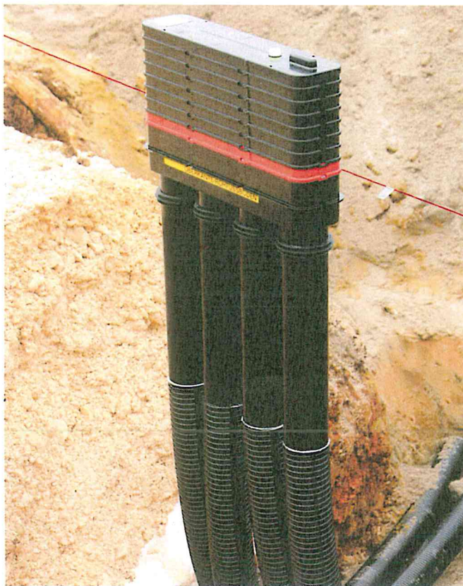
Grundkörper mit eingerasteten Leerrohrsystemen an eingeschlagener Aufstellvorrichtung fixieren