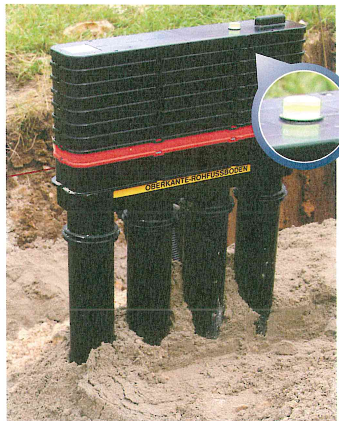
Grundkörper über Libelle ausrichten, einsanden - fertig

Bitte unbedingt die mitgelieferte Montageanleitung beachten!