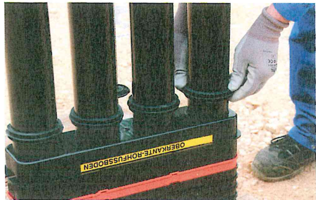
Wassersperrn bei Bedarf positionieren