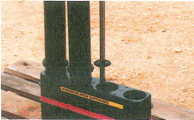
Mantelrohre in Grundkörper einstecken und einrasten